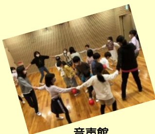
音声館 わらべうた教室